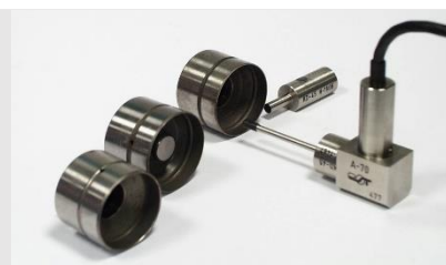
バケットタペット